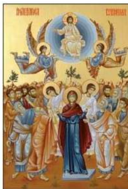
Înălțarea Domnului la cer