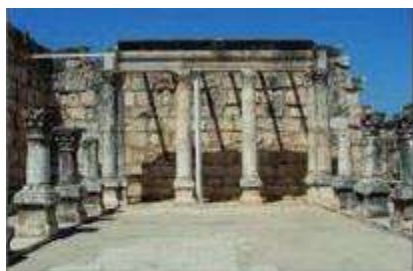
Imagine din vechiul oraș Capernaum