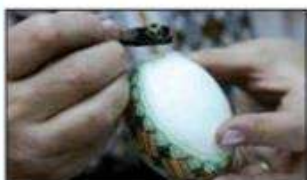
Pregătirea ouălor de Paști

Privește imaginile de pe marginile acestor două pagini și descrie ce reprezintă. La care din aceste obiceiuri ai participat și tu?