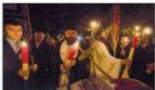
Participarea la slujba Învierii