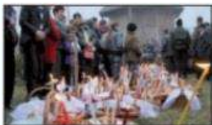
Sfințirea bucatelor de Paști