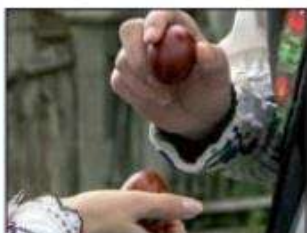
Ciocnirea ouălor roșii

Este galbenă, din ceară, Luminează-n noapte-afară, Când spre case noi pornim, Învierea să vestim.