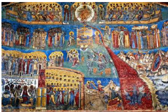
Scara Raiului, Manastirea Sucevita

Cartea de față arată în chip limpede cea mai bună cale, celor ce voiesc să-și înscrie numele în cartea vieții. Căci citind-o pe aceasta, o vom afla călăuzind fără rătăcire pe cei ce-i urmează și păzindu-i nevătămați de nici o poticnire. Ea ne înfățișează o scară întărită de la cele pămîntești la Sfintele Sfintelor și ni-L arată pe Dumnezeuul iubirii rezemat pe vârful ei. Această scară socotesc că a văzut-o și Iacov cel ce a călcat peste patimi, cînd se odihnea după nevoința lui. Dar să începem, rogu-vă, cu rîvnă și cu credință acest urcuș înțelegător și suitor la cer, al cărui început e lepădarea de cele pămîntești, iar sfîrșit, e Dumnezeuul iubirii.